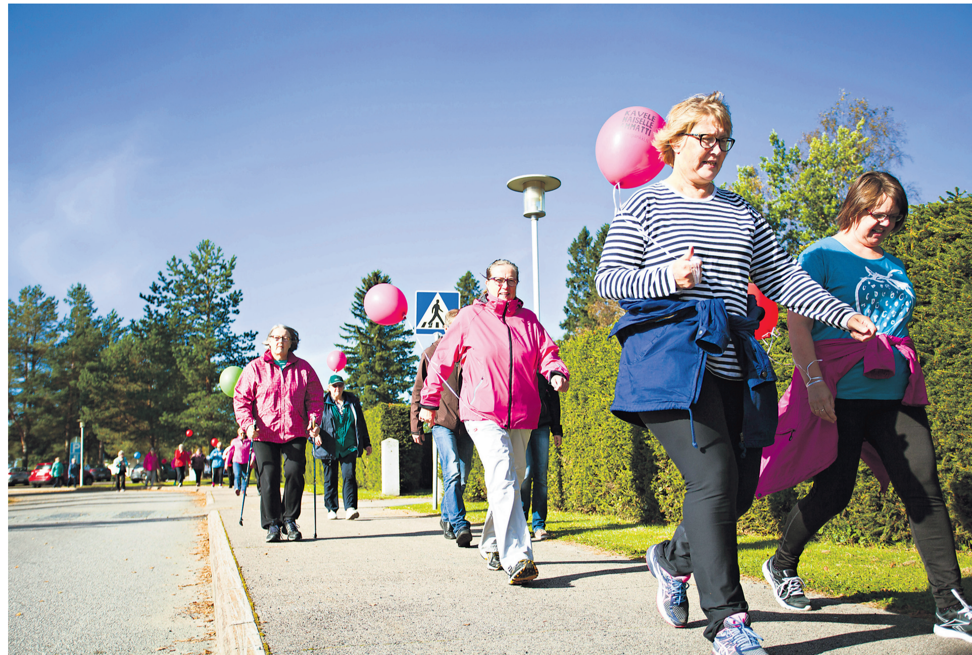
Syksyinen auringonpaiste hemmotteli Kävele naiselle ammatti -tapahtumaan osallistuneita

elämän välillä karikkoisilakin poluilla ja auttanut elämän välillä karikkoisilakin poluilla ja auttanut toivoa yllä”, Petri kertoo.