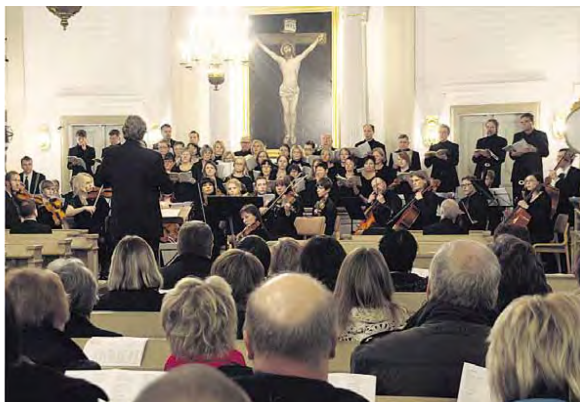
Haapaveden kamariorkesteri ja Jokilaaksojen oratoriokuoro esittämässä Mozartin Requiem-teosta Ylivieskan kirkossa viime Pyhäinpäivänä.